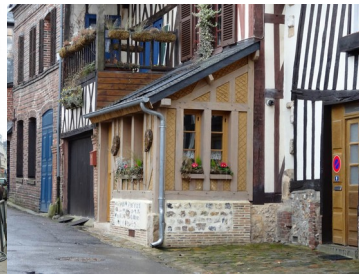
Les rues secondaires