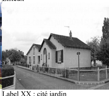
Label XX : cité jardin