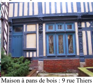
Maison à pans de bois : 9 rue Thiers