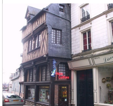
Maison à pans de bois : 6 rue Auguste Leprevost