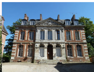
Hôtel de la Gabelle