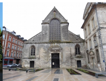
Ancienne Abbaye (tribunal, église abbatiale, hôtel de ville...)