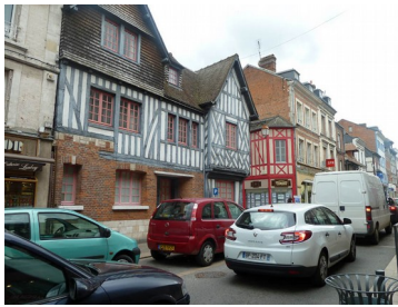
Vue sur la rue principale