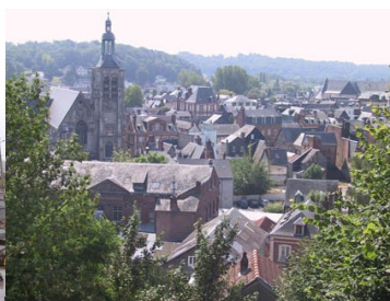
Eglise Sainte Croix