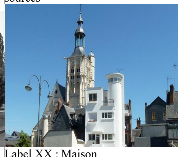
Label XX : Maison

Territoire occupé depuis l'époque néolithique (présence de nombreux dolmens et menhirs dans les environs, la commune de Bernay ne prend réellement son essor qu'à la fin du X e siècle lorsque Richard II, duc de Normandie, offre ce secteur du Duché Normand à son épouse Judith de Bretagne. Elle fondera une abbaye qui rayonnera de manière importante et qui structurera tous les environs. Les restes de l'ancienne abbaye sont d'ailleurs au coeur de la démarche de valorisation touristique et patrimoniale de la ville. En effet, les restes de l'église abbatiale (aujourd'hui musée) présentent des vestiges romans tout à fait remarquables qui placent ce monument au sein du trio de tête pour l'art roman dans l'Eure (avec Quillebeuf sur Seine et Saint Taurin à Evreux).