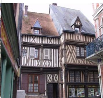
Maison à pans de bois : 8 rue Auguste Leprevost