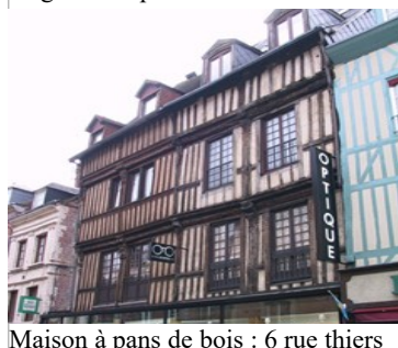
Maison à pans de bois : 6 rue thiers