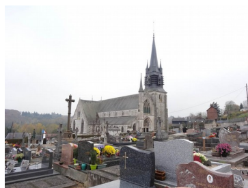
Eglise Notre Dame de la Couture

La commune de Bernay, située dans l'arrondissement de Bernay, est riche de quelques 10.000 habitants pour 10 monuments historiques, un site classé et deux labels XX e siècle.