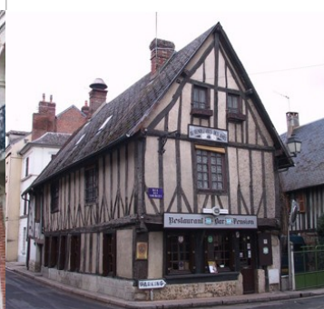
Maison à pans de bois : 16 rue de Lisieux