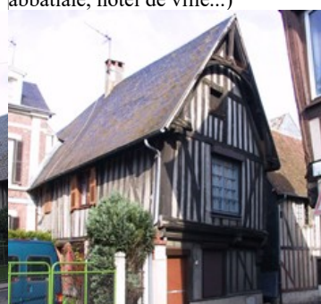
Maison à pans de bois : 5 rue des sources